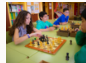
Actividad mental y emocional

Natación en el Centro del Agua, Piano, Guitarra, Patinaje, Robótica, Fútbol sala, Inglés, Música y movimiento, Pre-ballet, Karate, Gimnasia rítmica,, Teatro, etc.