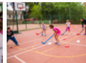
Actividad física y deporte escolar