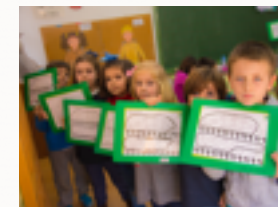
Atención personalizada y grupos reducidos