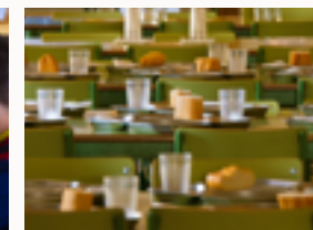
Educación para la salud